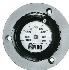
ノコ刃変速 インデックス