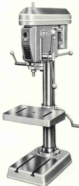
3 ~ 13mm深孔あけ用