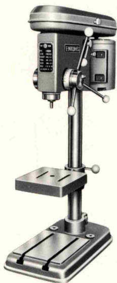
2 ~ 6.5mm小物孔あけ用