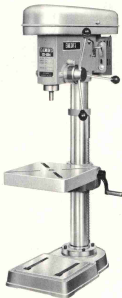
3 ~ 13mm普及型