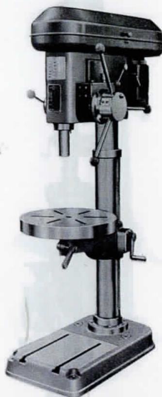
ESD-460 BT 形